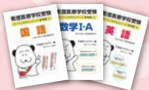
▲オープンセサミ参考書

学習用教材は、通学講座でも使用している「合格により近く」をモットーにした参考書と問題集です。自己学習で理解できなかったところは、添削課題を提出して添削を受けることで理解につながります。