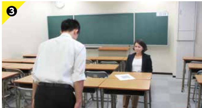
Point 3 着席姿勢や礼の仕方、良い表情や声の出し方も対策