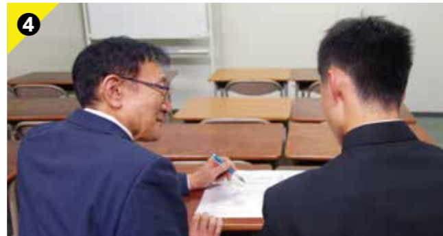
Point 4 面接カード作成アドバイス!