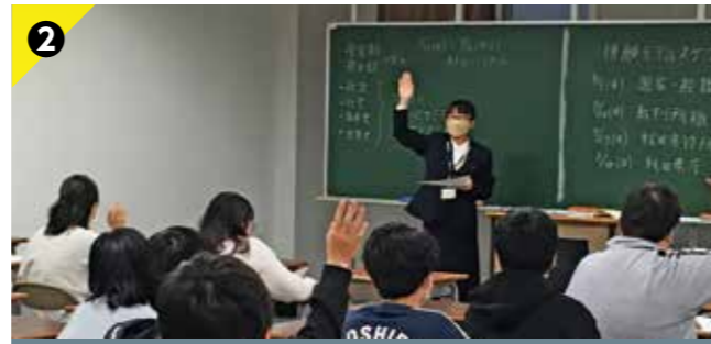
Point 2 公務員の仕事を知らう!