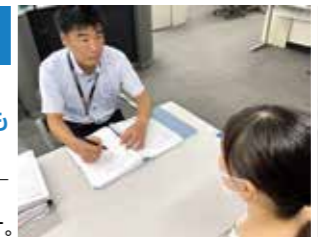
受講生の悩みを解決!