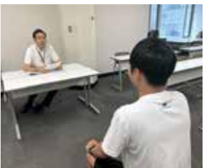
面接試験突破のためにアドバイス!