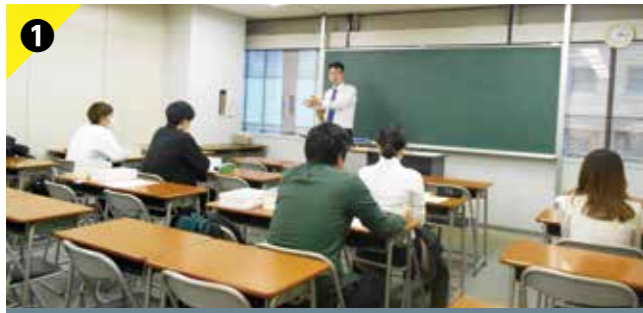
Point 1 面接対策を知ろう!