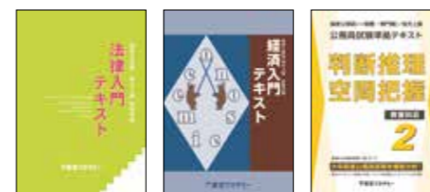
主な使用教材（写真は2024年度版です）

公務員試験対策スタートとしてまずは、教養科目全般の基礎知識習得を行います。また、専門の法律科目、経済科目はオリジナル入門テキストを使用し導入講義を行います。入門レベルからの対策で安心して受講開始できます。