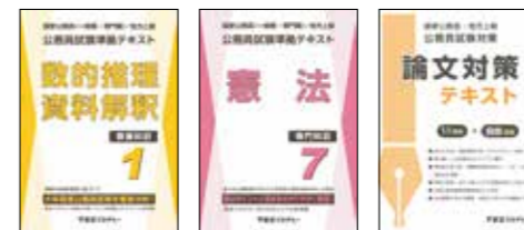
主な使用教材（写真は2024年度版です）

オリジナルテキスト「公務員試験準拠テキスト」シリーズを主に使用し、教養試験の頻出分野を効率よく学習し、各科目の重要分野を的確に押さえながら知識のインプットを行います。インプット式の学習により問題演習を行う上で必要な知識の習得、代表的な解法の構築を目指します。