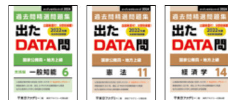
主な使用教材（写真は2023年度版です）

オリジナル過去問題集「出たDATA問」シリーズを使用します。実践レベルの問題に取り組み、本番に即したテクニックを磨き、アウトプットを行いながら知識の定着を図ります。