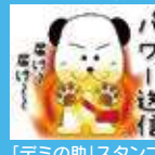
「デミの助」スタンプ