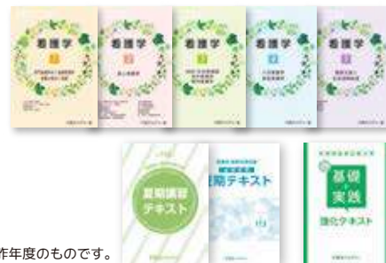
※一部画像は昨年度のものです。