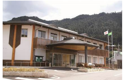
●清水行政局（有田川町清水387-1）