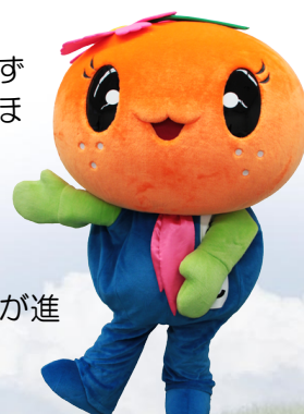
有田川Library イメージキャラクター “ありりん”

なお、配点は第1次から第3次試験までの総合得点方式ではなく、段階が進むごとにその都度成績はクリアされます。