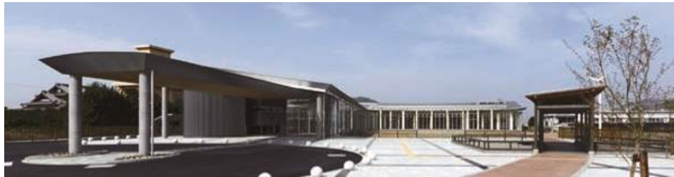
●“本のあるカフェ”地域交流センターALEC（有田川町下津野704）