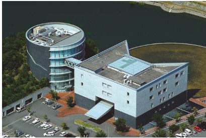
●吉備庁舎（有田川町下津野2018-4）