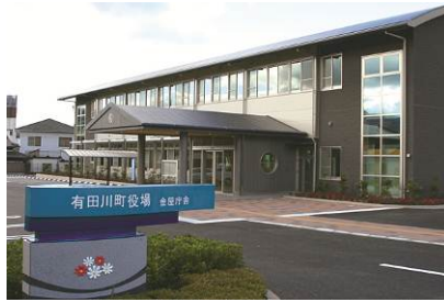
●金屋庁舎（有田川町中井原136-2）