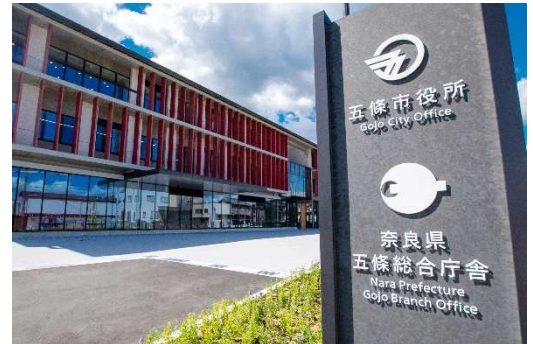
五條市役所（五條市岡口1丁目3番1号） ※JR五条駅から約500mです。